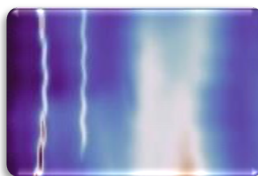
Visualisation d’impédance électrique de 2 câbles de télécommunications posées sur le fonds marins

ELWAVE est en très forte croissance depuis sa création :